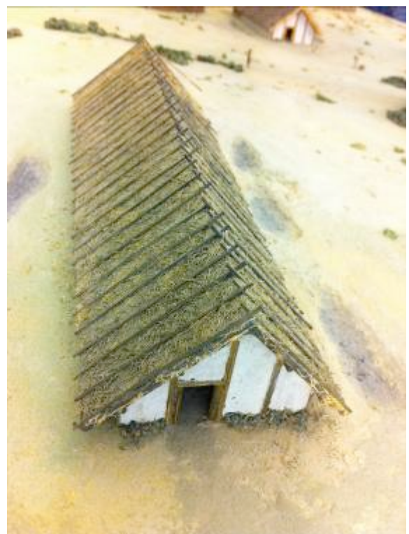
Reconstructie van een huis uit de Bandkeramiek