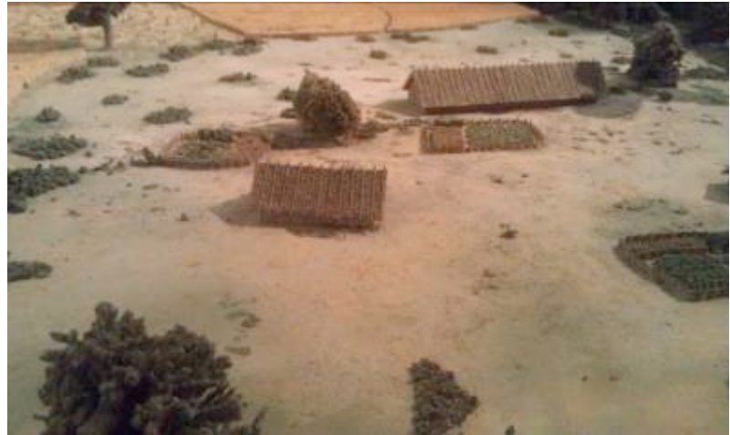
Reconstructie van een huis uit de Bandkeramiek