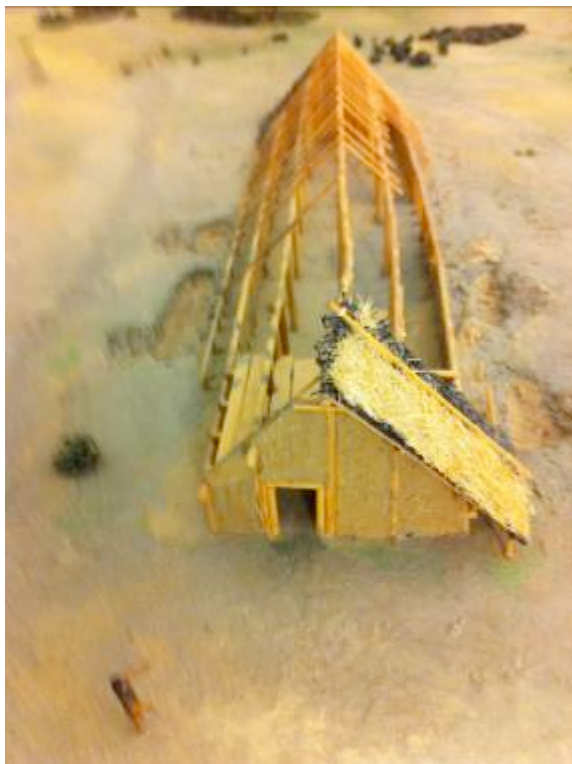
Reconstructie van een huis uit de Bandkeramiek