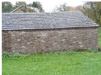
DSCF5170 . jpg