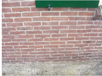
DSCF5134 . jpg