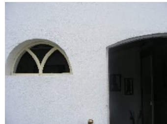
DSCF5167 . jpg