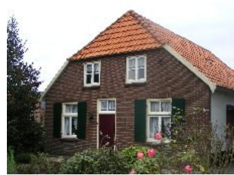
DSCF5135 . jpg