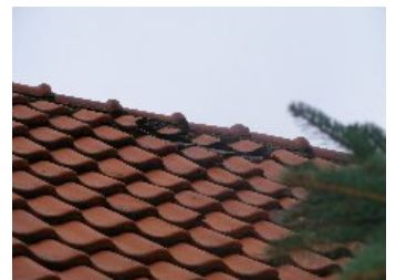
DSCF5144 . jpg