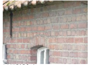
DSCF5156 . jpg