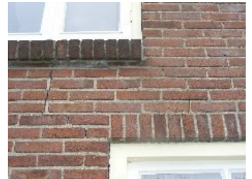
DSCF5140 . jpg