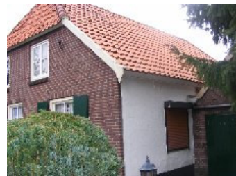
DSCF5143 . jpg