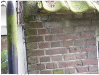
DSCF5153 . jpg