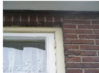
DSCF5139 . jpg