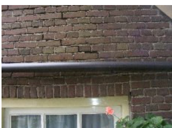
DSCF5149 . jpg