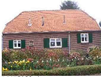
DSCF5130 . jpg