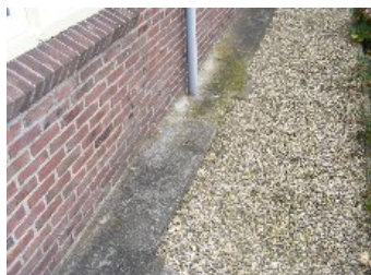
DSCF5174 . jpg