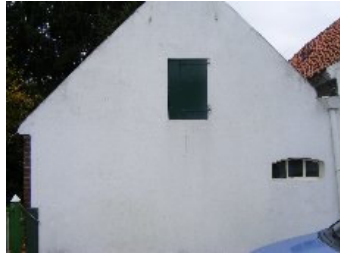
DSCF5158 . jpg