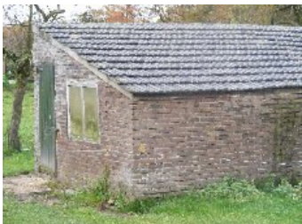
DSCF5169 . jpg