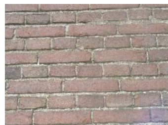
DSCF5147 . jpg