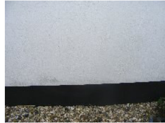
DSCF5159 . jpg