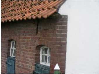
DSCF5157 . jpg