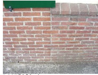
DSCF5131 . jpg