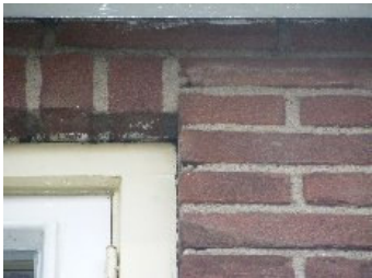
DSCF5137 . jpg