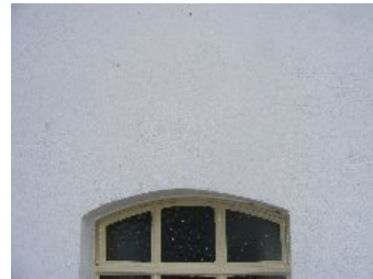
DSCF5163 . jpg