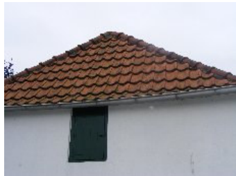
DSCF5162 . jpg