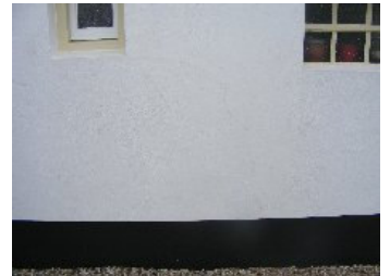
DSCF5164 . jpg