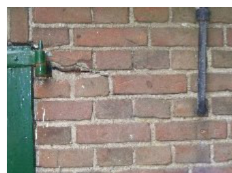
DSCF5151 . jpg