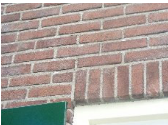
DSCF5141 . jpg