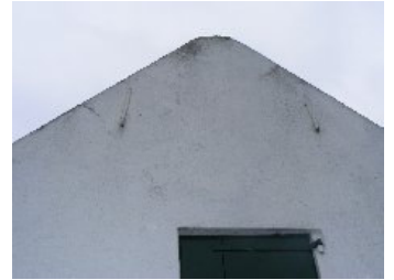
DSCF5160 . jpg