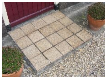
DSCF5142 . jpg