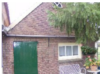
DSCF5146 . jpg