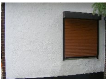
DSCF5145 . jpg