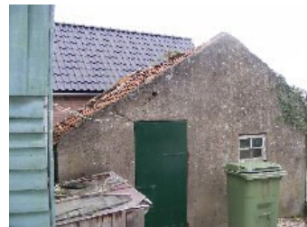
DSCF5171 . jpg