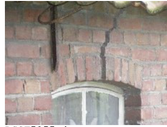
DSCF5155 . jpg