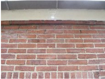
DSCF5133 . jpg