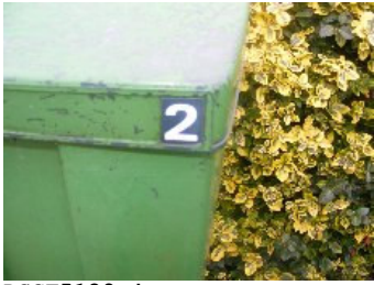
DSCF5129 . jpg