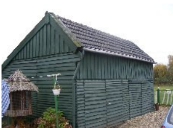
DSCF5173 . jpg