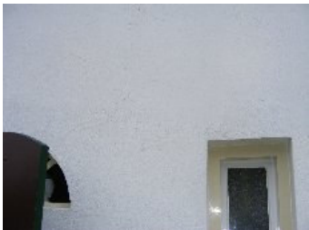
DSCF5165 . jpg