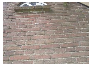
DSCF5148 . jpg