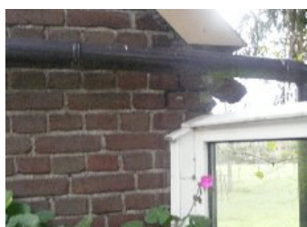
DSCF5150 . jpg