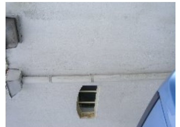
DSCF5168 . jpg