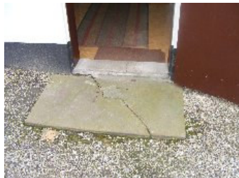
DSCF5166 . jpg