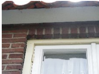
DSCF5138 . jpg