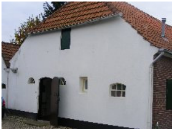
DSCF5161 . jpg