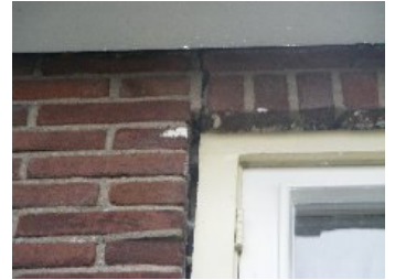
DSCF5136 . jpg