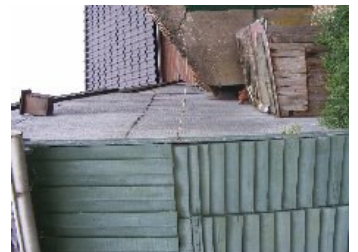
DSCF5172 . jpg