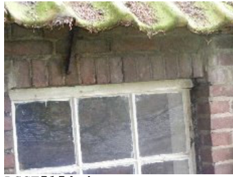
DSCF5154 . jpg