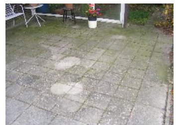
DSCF5176 . jpg