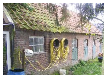
DSCF5152 . jpg