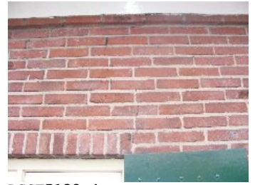
DSCF5132 . jpg